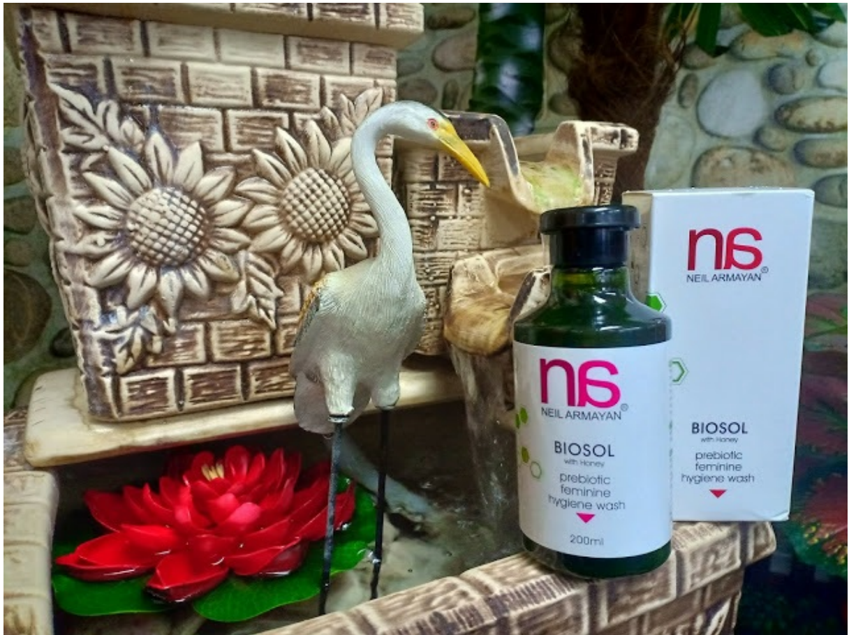
BIOSOL Prebiotic Feminine Hygiene Wash with Honey

Rumusan unik dari ekstrak tumbuhan semulajadi membantu memberikah khasiat, meremajakan dan pemulihan yang diperlukan oleh lapisan kulit, rupa dan penampilan bahagian intim sambil menghilangkan bau yang tidak menyenangkan.