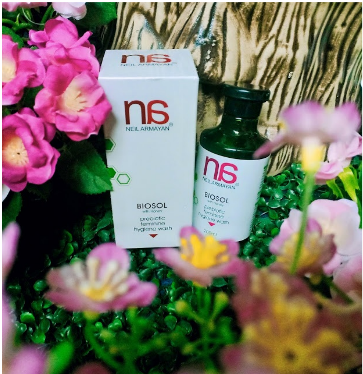
BIOSOL Prebiotic Feminine Hygiene Wash with Honey

Usah dikecewakan lagi oleh bau dan kesihatan bahagian intim yang kurang sempurna kerana penyelesaiannya sangat mudah. Alami pembaharuan menyeluruh, keriang dan semangat baru daripada kulit bahagian intim anda yang lembut dan licin.